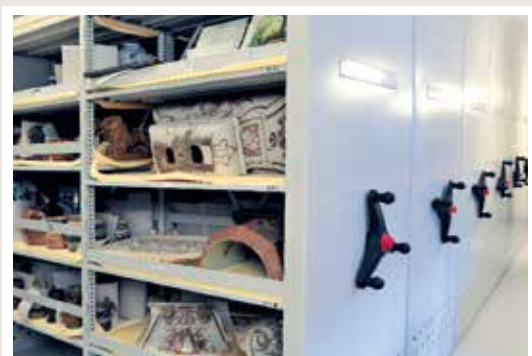
regały na zbiory specjalne