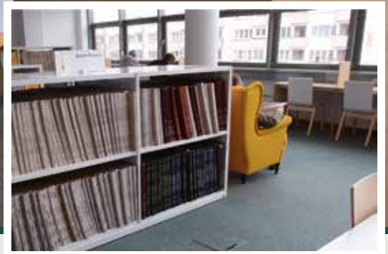
regał do czytelnicy i bibliotek

Regały stacjonarne najczęściej stosuje się w bibliotekach oraz czytelnicy. Dzięki nieograniczonej możliwości aranżacji i wykonania regałów jesteśmy w stanie dopasować je do wymiarów, stylu i kolorystyki pomieszczenia. Możemy odpowiednio wyeksponować książki oraz czasopisma. Regały mogą być z panelem metalowym, z panelem drewnianym itp.