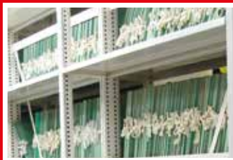
ściana słupkowa otwarta