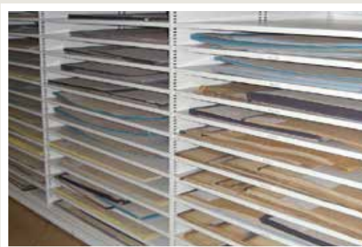
regały na mapy, plany, itp