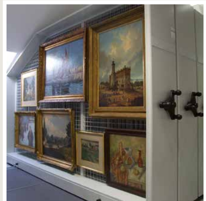
regały przesuwne na obrazy