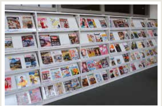
regał na czasopisma z półką uchylną