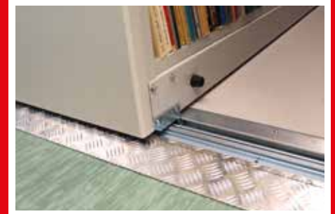
szyna z dodatkową podłogą