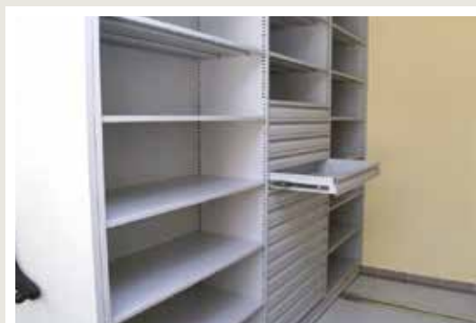
regał z wysuwaną szufladą