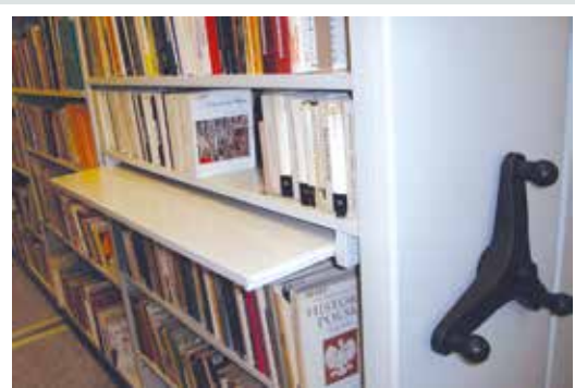
regał z wysuwanymi półkami

Konstrukcja napędu regałów pozwala na „łagodny” start i zatrzymanie regału tak aby regały nie uderzały o siebie przy zatrzymaniu, a przechowywane materiały nie przesuwały się na półkach podczas ruchu regałów, dzięki temu regały te możemy zastosować w muzeach do przechowywania kruchych eksponatów, np. naczyń glinianych czy porcelany.