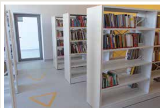
regał stacjonarny z panelem drewnianym