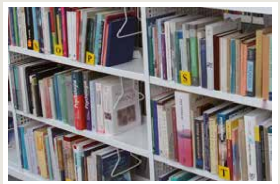
zastosowanie przegrody podwieszanej w regale bibliotecznym

Regały stacjonarne najczęściej stosuje się w bibliotekach oraz czytelnicy. Dzięki nieograniczonej możliwości aranżacji i wykonania regałów jesteśmy w stanie dopasować je do wymiarów, stylu i kolorystyki pomieszczenia. Możemy odpowiednio wyeksponować książki oraz czasopisma. Regały mogą być z panelem metalowym, z panelem drewnianym itp.