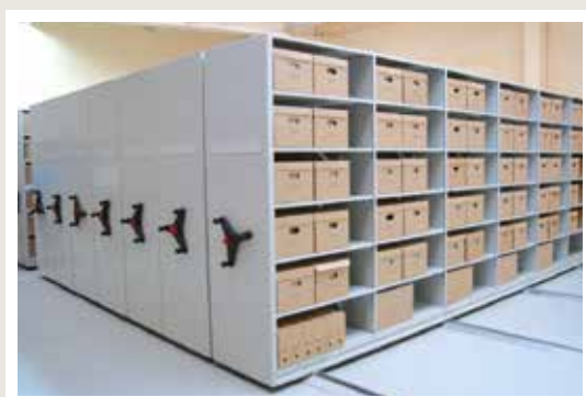
regały przesuwne archiwalne