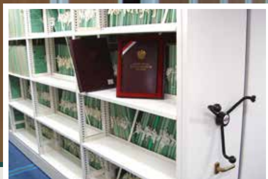
regały ze ściankami bocznymi typu słupkowego w archiwum