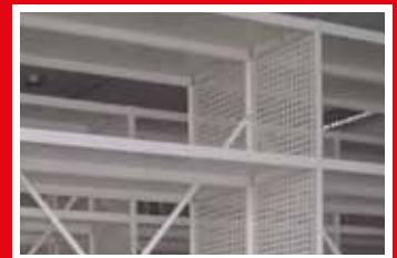
ściana boczna perforowana