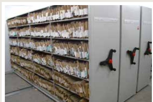
regały na akta