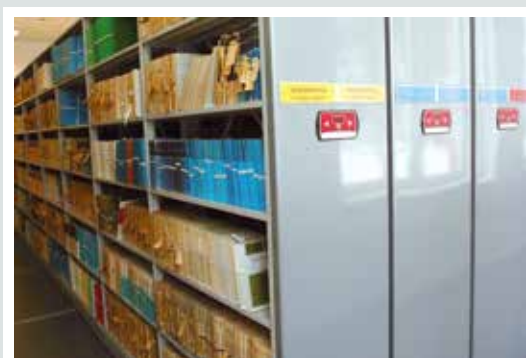
regały z napędem elektrycznym w bibliotece