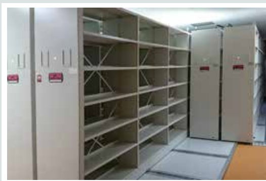
regały z napędem elektrycznym w archiwum