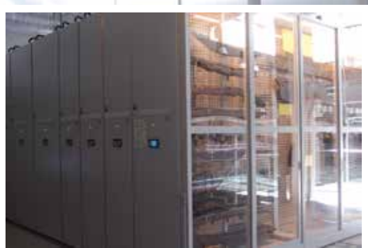
drzwi przesuwne oraz oświetlenie ekspozycji