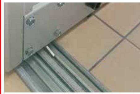
szyna "zatapiana" w posadzce