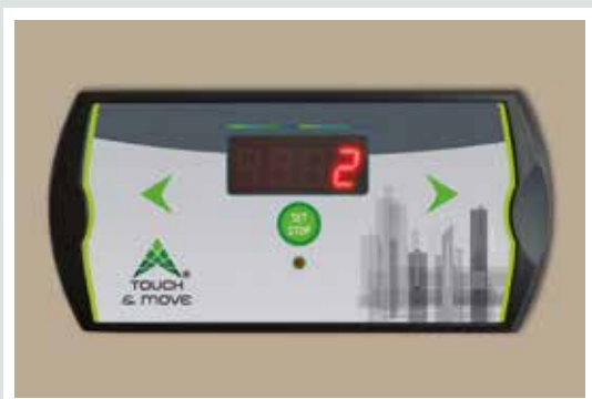
panel sterowniczy z wyświetlaczem