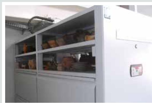
szuflady i półki na ekspozycję - naczynia gliniane