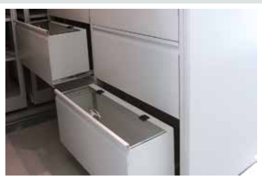
regał z szufladami - gablotami