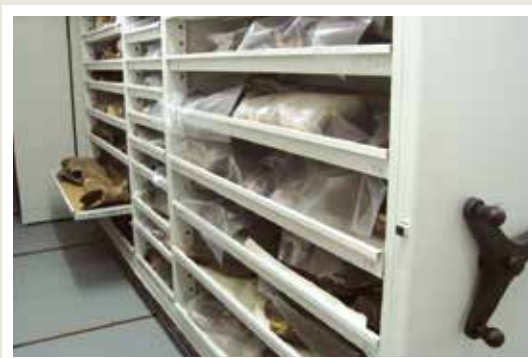
regały na zbiory specjalne