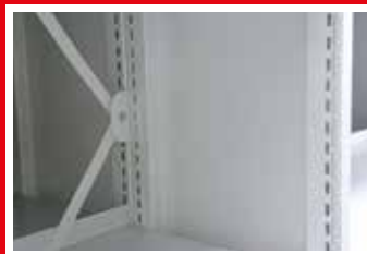
ściana słupkowa pojedyncza