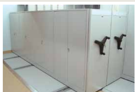
regał z zamykanymi drzwiami

Projektowanie „na wymiar” umożliwia instalowanie na końcach regałów drzwi, które mogą być zamykane na klucz.