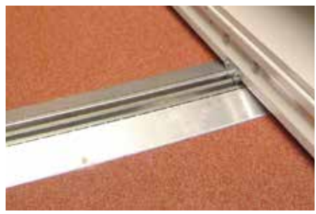
szyna nawierzchniowa z najздadami

t 58 306 58 42, 58 306 59 56 f 58 306 58 42 @ biuro@regnar.pl