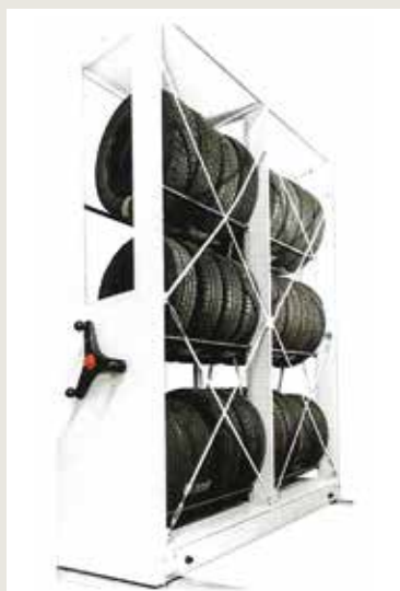
regały magazynowe na opony

Dzięki nieograniczonym możliwościom aranżacji i wykonania regałów jesteśmy w stanie maksymalnie wykorzystać każde pomieszczenie, uwzględniając istniejące przeszkody (rury kanalizacyjne, podciągi, przejścia).